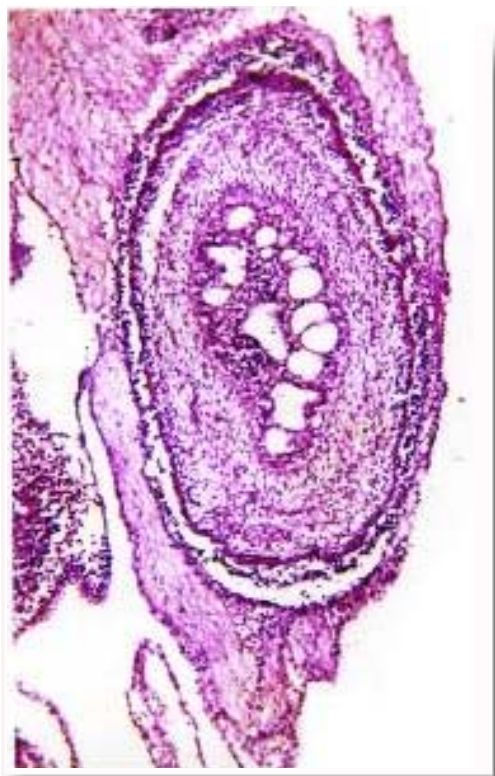
Рис. 3. Горизонтальний зріз стравоходу передплода 16,0 мм ТКД. 1 – вакуолі в епітеліальному шарі слизової оболонки; 2 – підслизовий шар слизової оболонки; 3 – м'язова оболонка стравоходу. Забарвлення гематоксиліном та еозином, \times 56 .