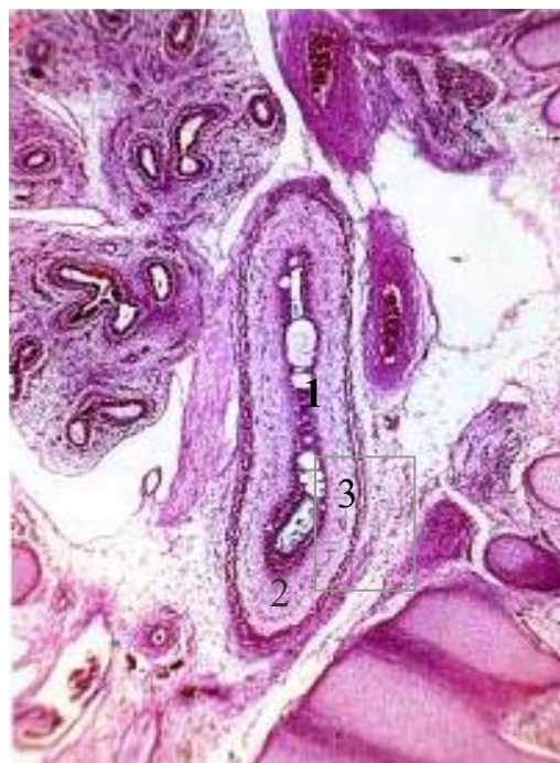
Рис. 4. Сагітальний зріз стравоходу передплода 24,0 мм ТКД. 1 – вакуолі в епітеліальному шарі слизової оболонки; 2 – підслизовий шар слизової оболонки; 3 – м'язова оболонка стравоходу. Забарвлення гематоксиліном та еозином. \times 56 .