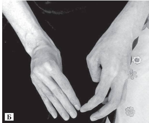
Рис. 2. Спастичний парез кистей обох рук: вигляд збоку (А) та зверху (Б)

не, поперхування. Груба дизартрія, розуміння мови хворого значно утруднене, слів не вимовляє, іноді виникають епізоди анартрії. Контакт з медичним персоналом лікарні відбувається за допомогою кивків голови, покліпування повік, які пацієнт здійснює у відповідь на поставлені запитання. Візуально завжди радий контактам зі співробітниками лікарні, студентами. Предметне спілкування із хворим здійснюється за допомогою матері, яка за мімікою, окремими звуками, рухами очей добре розуміє хворого, висловлює його бажання щось сказати, на що пацієнт ствердно киває головою чи кліпає повіками. Зі слів матері, епізодів депресивного стану у пацієнта не спостерігалось, однак за останніх кілька місяців хворий безпричинно стає дедалі більше роздратованим.