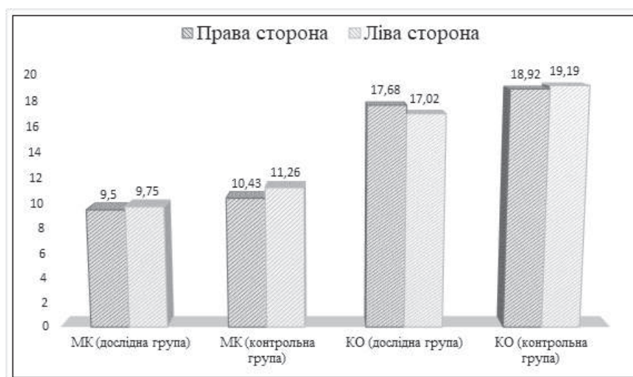
Рис. 3. Порівняння кількісних показників морфометричного визначення (мм) топографо-анатомічної мінливості каналу нижньої щелепи при атрофії кісткової тканини, зумовленої втратою жувальної групи зубів, на сагітальному зрізі кутового перерізу від краю позаду молярної ямки до каналу нижньої щелепи (МК) та від каналу нижньої щелепи до середини зовнішнього краю її кута (КО) між лівою та правою сторонами, у людей віком 25-75 років, n=68.

середнім значенням 17,68 мм у дослідних групах та 18,92 мм – у групі контролю (зі збереженими зубними рядами). У свою чергу ліва сторона характеризується відстанню КО за середнім значенням 17,02 мм у дослідних групах та 19,19 мм – у групі контролю (рис. 3).