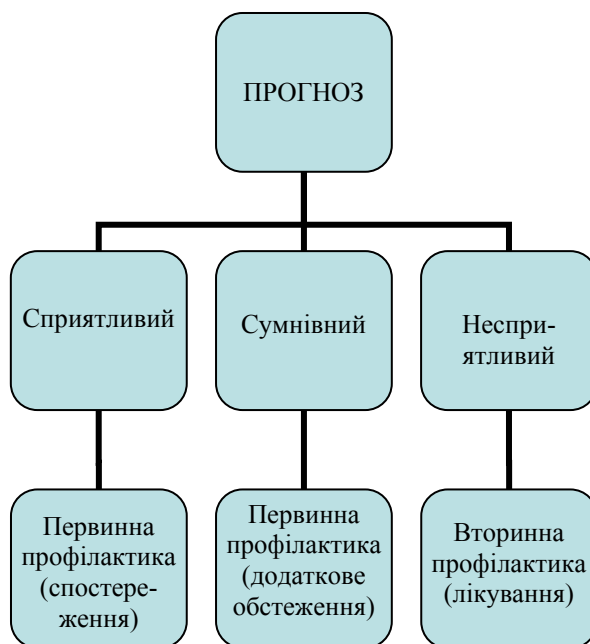
Рис. 2. Схема дій лікаря за результатами прогнозу

Як бачимо, 13,2 % респондентів не контролювані й не керовані медичними працівниками, а 48,1 % осіб тільки частково спостерігаються лікарем, тому їх необхідно зарахувати до групи ризику, адже загальновідомо, що диспансеризація є основою медичної профілактики.