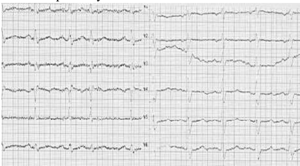
Клінічна та експериментальна патологія. 2019. Т.18, №3 (69)