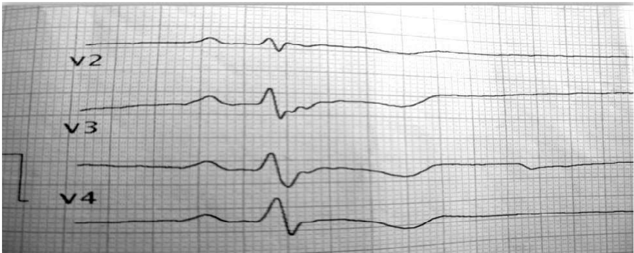
Рисунок 1. Епізоди появи епсілон-хвиль

лежно від ЧСС реєструвалися дуже часті (всього 1551) поліморфні шлуночкові передчасні скорочення, у тому числі парні (48) моно- та поліморфні, вислизуючі в паузах та у вигляді різної тривалості епізодів бі-, три- та квадригемінії. Тип шлуночкової екстрасистоїї денний. Зареєстровані пароксизми моно- і поліморфної шлуночкової тахікардії (рис.2). Епізодів ішемії міокарда не виявлено, діагностично важливої динаміки ST не спостерігалось.