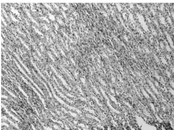
Рис. 3. Фото мікропрепарату нирки щура із створеною внутрішньочеревною гіпертензією тривалістю 24 години. Слабко виражене венозне повнокров'я я мозкової речовини. Гематоксилін і еозин. Об.9 x .Ок.10 x

пічної дистрофії, вираженість якої мінлива по паренхімі печінки (рис. 1).