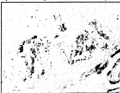
Рис. 1. Осередок фібриноїду плаценти з депозитами кальцію. Депозити кальцію гранулярної структури (наведені стрілками). Гематоксилін і еозин. Об. 40 x . Ок. 10 x

Тип II – це множинні дрібнозернисті пілоподібні групи депозитів кальцію. Вони можуть бути в різних частинах фібриноїдних тіл, а також рівномірно “перемішуватися” з фібриноідом по всьому його об'єму. Підвидом такого різновиду